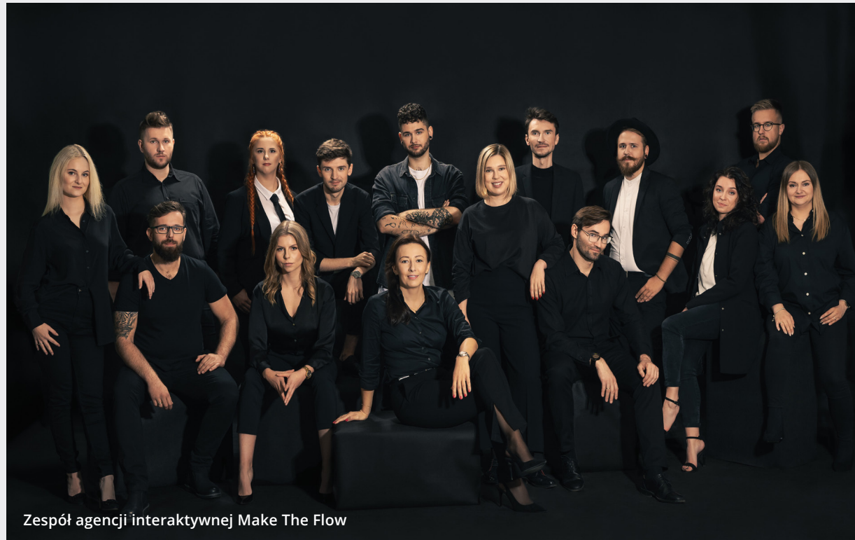
Zespół agencji interaktywnej Make The Flow